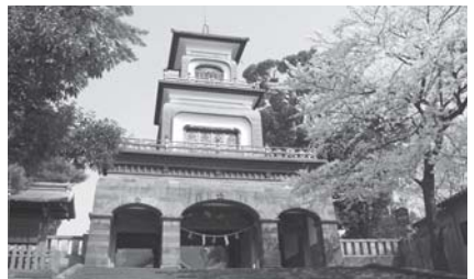
オランダ人設計の尾山神社神門

年に建てられたユニークな神門は和洋洋の三様式を折衷し、3層の望楼は伝統的なスタイルとは一線を画したデザインだ。高樓の窓は四面に五彩のギヤマンをはじめこんだモダンなもので灯