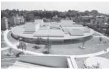
ユニークな円型的美術館

同じ頃(2004年、兼六園と道路を隔てて、斬新な円形ガラスの金沢21世紀美術館が誕生