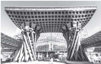
「鼓門」と背後の「もてなしドーム」（金沢駅前）

北陸新幹線が金沢まで延伸して今年3月14日で3年たった。新幹線効果で金沢は観光客で賑わっている。兼六園口へ出る駅前広場の巨大なガラスの「もてなしドーム」と歓迎ゲート「鼓