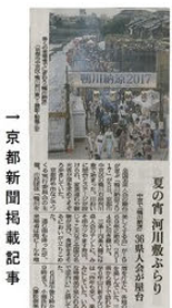
一京都新聞掲載記事

観光パンフレット、チラシを配布し、山田京都府知事をはじめ、多くのお客様に石川県の魅力をPRできました。