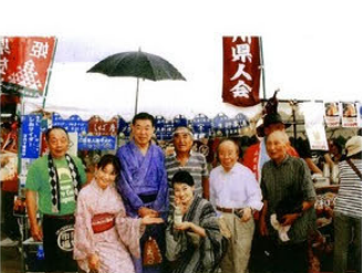
<山田京都府知事と記念撮影>