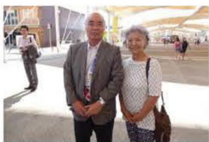
萬歳章 前全国農業協同組合中央会会長と