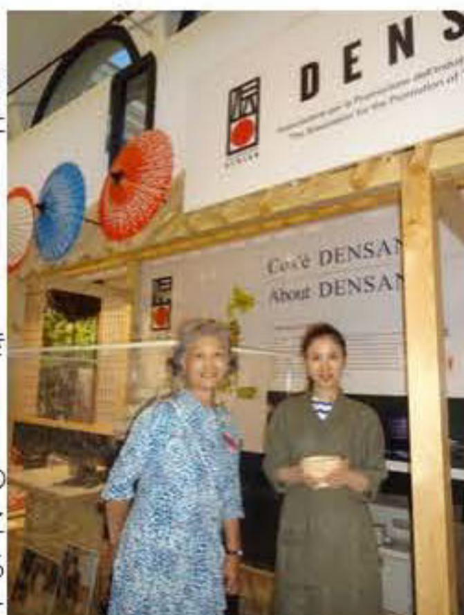
ジャパンサローネの会場にて

イタリア・ミラノでは計3回にわたって石川県のことを知っていただく機会に恵まれましたが、こうやって日本を離れ海外にて石川県の紹介をするとなまた違った面からの石川県の魅力に気づくことを、身をもって体感しました。