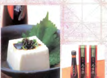
■吉市醤油店 激辛 太古楽 和風東蛮醬.....1,200円

古代米とは、我々の祖先が栽培していた古代の稲の品種の特色を色濃く残している米。現在の米にはない栄養成分も含まれており、健康食品としても注目を集めている。厳選した小麦粉に古代米をブレンドして練り込んだ乾麺のうどん、つるつるとした喉ごしがたまらない逸品。美しい色合いも特徴。