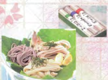
■各農園 古代米うどん.....黒、赤、緑米各472円

雑味のないシャープな辛さ、すっきりとした後口。シャキシャキとした食感も爽やかな「まわさび和え」。そのままはもちろん、納豆やサラダ、卵かけごはんなど、おなじみの食材や料理とも相性抜群。辛み、旨味、香りの三拍子が楽しめます。「食べてみたい」とその美味しさが理解して「頂けない」のが欠点のこと。