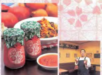
■イルピアット ハタダ まんでとまと.....840円

1786年創業の酒蔵が商品化。大吟醸の酒粕、能登の塩をブレンドした一夜漬の素です。何よりの魅力は様々な食材に手軽に応用できること。野菜なら素がなじむように混ぜて冷蔵庫に一晩置けば、おいしい漬物に。肉、魚などは素を薄く塗り冷蔵庫で2日程おいて焼けば酒粕風味の一品が完成。