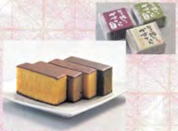
■株式会社サンライフ 能登嶺の里 能登地どりかすてら.....各680円

加賀市で栽培されている茶葉から生まれた石川県産の紅茶。その風味と香りを北陸産の米を原料にしてぎゅっと閉じ込めた米飴です。 和テイストの風味、豊かな香りがずうっと楽しめ、飽きのこない甘味がポイントです。