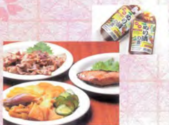
■株式会社 久世酒造店 酒粕風味のめり漬の素.....298円

うるち米と大麦のみを原料とした、松波地区で五百年以上伝わる伝統の米飴を使ったプリンがついにデビュー。一口食べれば、なめらかな口当たりと思わず顔がほころぶ、絶妙な蒸し加減。砂糖とはひと味違ったお米のほんのりとした甘さが老若男女に愛されるポイントになっています。