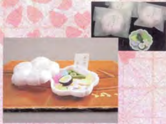
■御菓子屋調進所 山海堂 はるほの(3個人入り).....1,000円