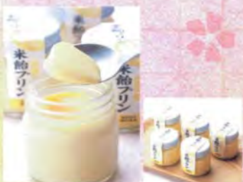
■横井商店 米飴プリン.....315円

世界農業遺産に認定された能登の里山で、安心・安全にこだわり、自家配合した無添加の自然飼料や海洋深層水を与えてのびのびと育てられている鶏。そんな能登地どり自然卵の濃い味をそのまま活かした、従来にはない口当たりのカステラです。濃厚な卵黄と卵白から生まれるもちもち感は独特。