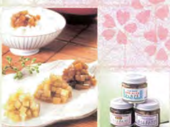
■わさびくん本舗 わさびくん醤油油.....630円

七尾のイタリアン「ハタダ」のシェフ特製マトソース。能登で作られた玉ねぎや人参を炒めて真ごしトマトと合わせてじっくり煮込んで作られたこのソースは、パスタにはもちろん、パンに塗ってピザソースとしてもやスープやカレーの隠し味として幅広く楽しめます。「まんで」は能登の方言で「とても」という意味。