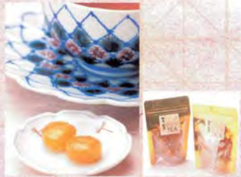
■茶レンジの会 加賀の紅茶・米飴 (10粒入り).....265円

最中の皮の中に、四季の彩りを表現した多種多様な加賀の御菓子と御札を詰め込んだ一品。最中の中で揺れる御菓子の音、見た目の美しい装飾、そして味わいと、五感で楽しめるように創作されたお菓子です。また御札に書かれた言葉で楽しい会話のひと時を過ごすように願ったものです。