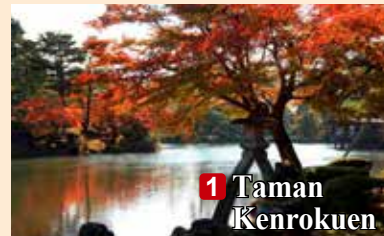
1 Taman Kenrokuen

↓ Masih banyak tempat bagus di Ishikawa untuk menikmati daun musim gugur. ↓