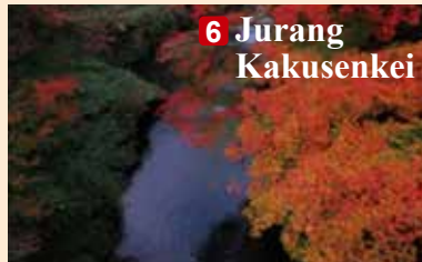
6 Jurang Kakusenkei

■ Kontak: Benteng Kanazawa / Kantor Manajemen Kenrokuen (TEL: 076-234-3800)