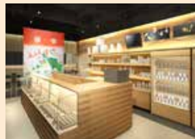
*Gambar hanya ilustrasi

Area perbelanjaan Kanazawa Hyakubangai di JR Stasiun Kanazawa dimana Toko Souvenir dan Toko Makanan berada telah dibuka kembali dengan nama "Anto". Kontak: Kamazawa Hyakubangai (TEL: 076-260-3700) http://www.100bangai.co.jp/floor/floorinfo.php?floor=omiyage