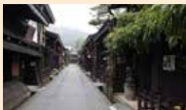
Pemandangan kota tua Takayama