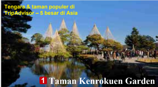
Tengara & taman populer di TripAdvisor – 5 besar di Asia