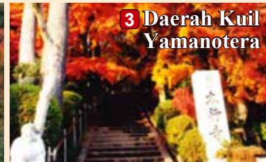
3 Daerah Kuil Yamanotera

■ Kontak: Kuil Natadera (TEL: 0761-65-2111)