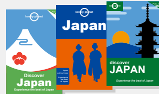
*Gambar hanya ilustrasi

Majalah travel Amerika Travel + Leisure memilih stasiun ini sebagai salah satu Stasiun Terindah di Dunia.