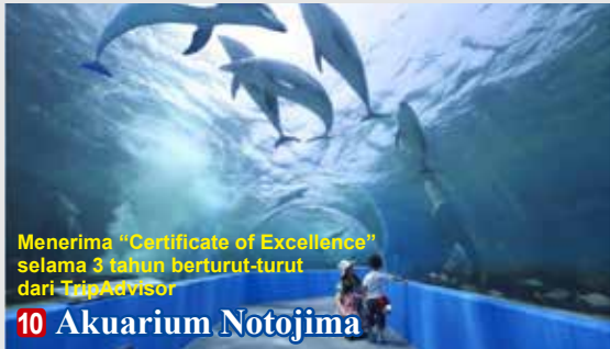
Menerima "Certificate of Excellence" selama 3 tahun berturut-turut dari TripAdvisor

Taman ini dimasukkan ke ranking 5 besardi Asia berdasarkan opini pengguna di situs travel terbesar dunia Trip Advisor pada kategori tengara dan taman.