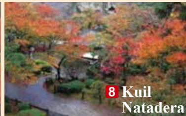
8 Kuil Natadera

■ Kontak: Asosiasi Pariwisata Yamanaka Onsen (TEL: 0761-78-0330)