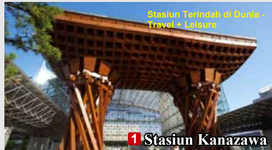
Stasiun Terindah di Dunia - Travel + Leisure

Akurium ini telah dianugerahi "Certificate of Excellence" selama 3 tahun berturut-turut karena mendapatkan penilaian tinggi dari pengguna di TripAdvisor.