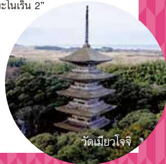
วัดเมียวโจจิ