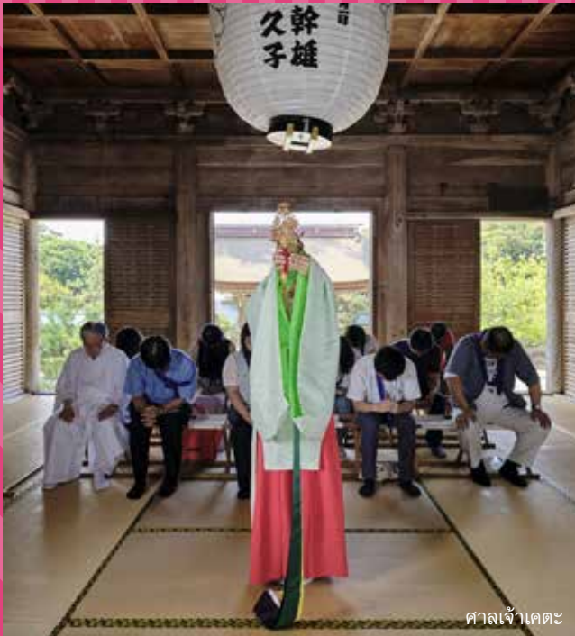
ศาลเจ้าเคตะ