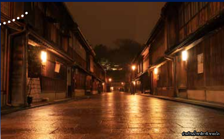
ย่านร้านน้ำชาอิคาชิ-ซาโยโก

การเดินทาง: นั่งรถประจำทาง 7 นาทีจากทางออกเค็นโรคุเอ็น (ฝั่งตะวันออก) ของสถานีคานาซาวะ → ลงรถที่ป้ายรถประจำทางซาชิบะโจ → เดิน 5 นาที