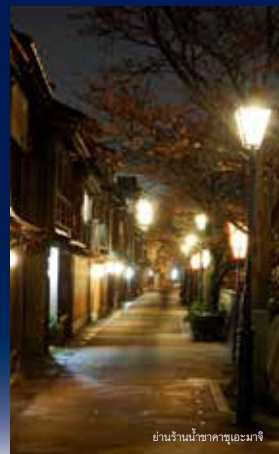
ย่านร้านน้ำชาคาซุเอะมาจิ