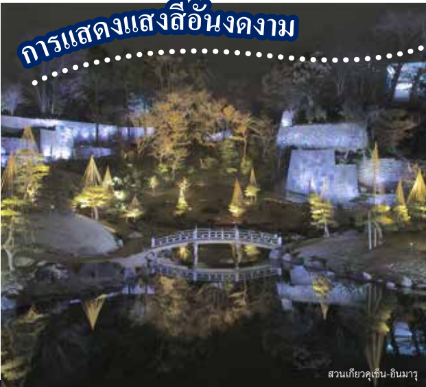
สวนเกียวคุเซ็น-อินมารุ