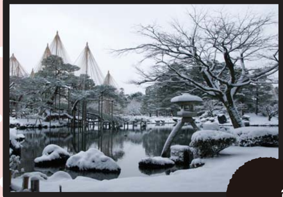
สวนเคนโรคุเอ็น