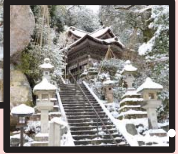
วัดนาคาเดระ