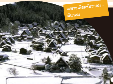
เฉพาะเดือนธันวาคม - มีนาคม