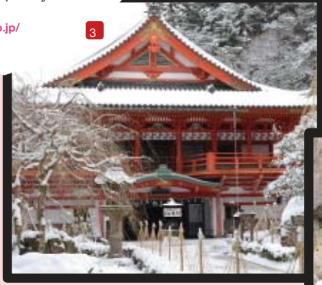
นอกจากจะมีชื่อเสียงเรื่องใบไม้เปลี่ยนสีในฤดูใบไม้ร่วงแล้ว ในฤดูหนาว วัดนาคาเดระที่ปกคลุมไปด้วยหิมะก็เต็มไปด้วยจุดชมวิวมามากมายเช่นกัน

อิจิริโนะออนเซ็นโรอัน ที่นี่ได้รับความนิยมในเรื่องบ่อน้ำร้อนกลางแจ้งส่วนตัวและการรับประทานอาหารรอบเตาอิโรริ ในช่วงฤดูหนาวคุณจะได้เพลิดเพลินกับการแช่น้ำพุร้อนกับชมวิวดูหิมะ อีกทั้งยังมีแพ็คเกจแบบไปเช้าเย็นกลับให้บริการด้วย อาหารรอบเตาอิโรริจะใช้วัตถุดิบที่คัดสรรมาอย่างดี เช่น ปลาสุกซาร์ เนื้อวัวญี่ปุ่น อาหารป่า เต้าหู้แข็งยากุซัง ผักกูด และผักกอร์แกนิก http://www.ichirino.jp/