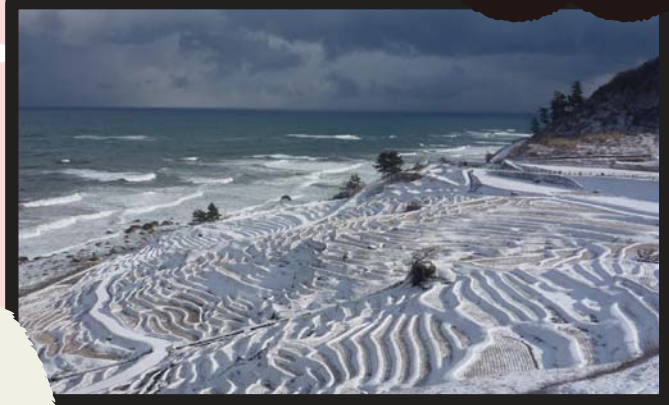
นาข้าวแบบขั้นบันไดเซ็นไมดะ

สถานที่ท่องเที่ยว ทัศนียภาพยอดเยี่ยมในฤดูหนาว