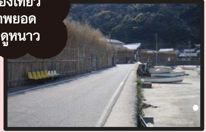
รั้วมากาคิ