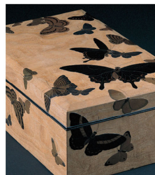
高野松山《群蝶木地時絵手箱》(部分) 1963