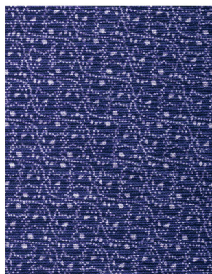
小宮康義《江戸小紋 着尺 「ゲンガー・ゴースト」》(部分) 2022