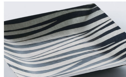
関谷四郎《赤銅銀接合皿》(部分) 1972