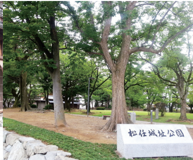
松任城址公園(松任)