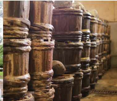
あら与のふぐ樽(美川)