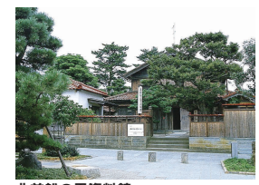
北前船の里資料館