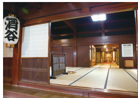
北前船の里資料館