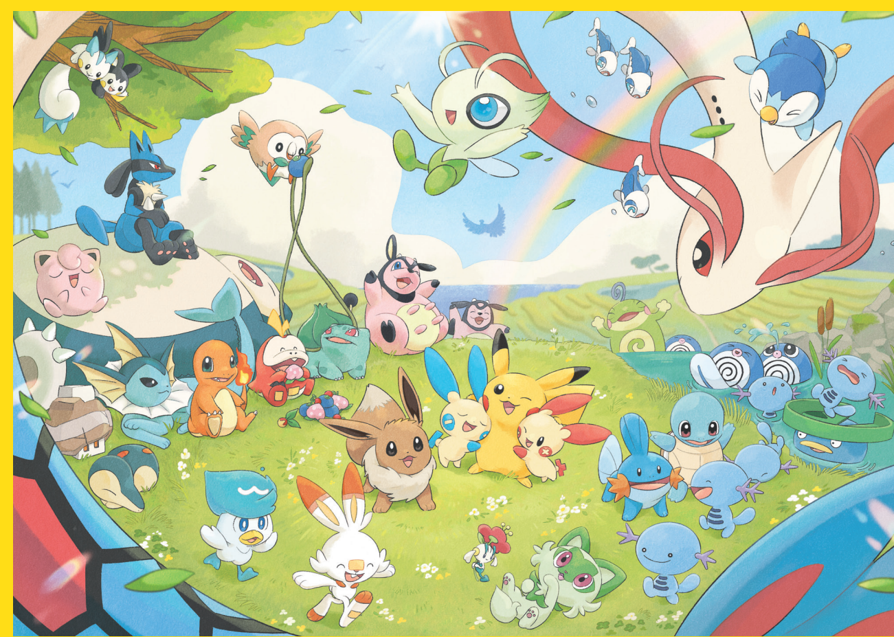
能登復興メインアート『あかるいみらい』