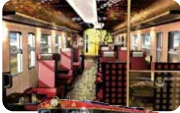
화(和)와 미(美)를 통한 대접

http://www.westjr.co.jp/pr/ess/article/2014/07/page_5866.html