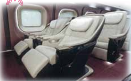
전담 엔터테인먼트가 승무하는 최상급 특별차량인 '그란클래스'를 도입.