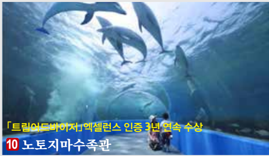
「트립어드바이저」엑셀런스 인증 3년 연속 수상

미국 여행잡지 「트래블레저」에서, 지구촌에서 가장 아름다운 역 중의 하나로 선정되었습니다.