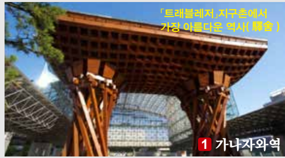
「트래블레저」지구촌에서 가장 아름다운 역사(羅倉)

세계최대의 여행 사이트인 「트립어드바이저」세계의 인기 랜드마크·공원부문에 있어서 아시아에서 5위로 선정되었습니다.