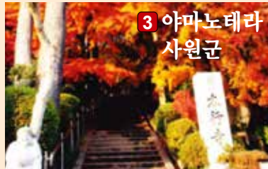
3 야마노테라 사원군

16곳의 사찰로 구성된 사원군. 그 중 하나인 혼교지(本行寺)는「단풍사」라고도 불리고 있습니다. 수령700년이나 되는 모밀잣밤나무를 비롯하여, 물든 사계절의 초목을 바라보며 즐기는 산책은 최고입니다.