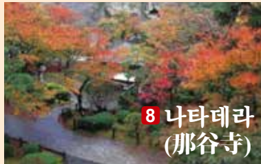
8 나타데라 (那谷寺)

기암으로 둘러싸인 1300년 역사를 가진 사찰입니다. 광대한 경내에는 기암이나 연못과 단풍이 조화를 이뤄 그 경치가 절정을 이룹니다.