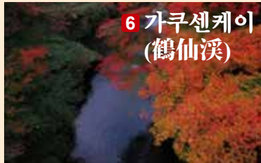
6 가쿠센케이 (鶴仙溪)

■문의처: 가나자와성·겐로쿠엔 관리사무실(TEL +81-76-234-3800)