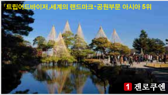
「트립어드바이저」세계의 랜드마크·공원부문 아시아 5위