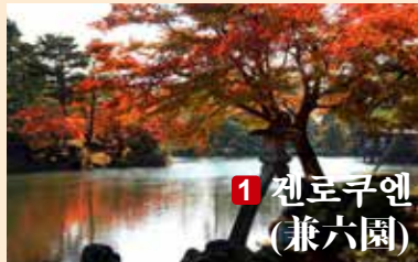
1 겐로쿠엔 (兼六園)

관광객뿐 아니라 지역주민들에게도 인기 있는 이시카와현의 심볼입니다. 단풍시기가 되면 단풍구경객들로 인산인해를 이룰 정도입니다.