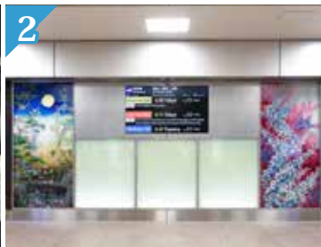
2 Dinding yang diwarnai dengan kertas khas Jepang dan kagayuzen