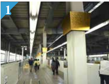
1 Tiang di platform Shinkansen yang dihiasai 20 ribu lebih sepuhan emas