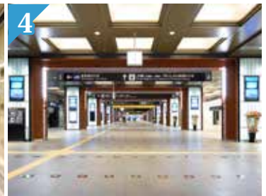
4 Tiang gerbang yang dibuat seperti pagar Taiko