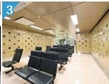
3 Dinding di ruang tunggu, dihiasai 236 buah 30 macam kerajinan tradisional.