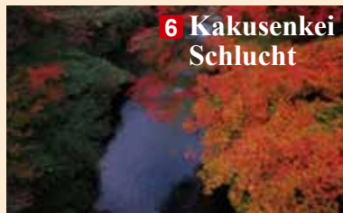
6 Kakusenkei Schlucht

■ Auskunft: Schloss Kanazawa / Kenrokuen Management Büro (TEL: 076-234-3800)