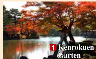
1 Kenrokuen Garten

↓ In Ishikawa gibt es noch mehr Stellen, um die Herbstlaubfärbung zu bewundern. ↓