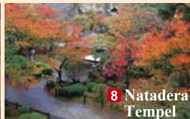
8 Natadera Tempel

■ Auskunft: Yamanaka Onsen Tourismusverband (TEL: 0761-78-0330)