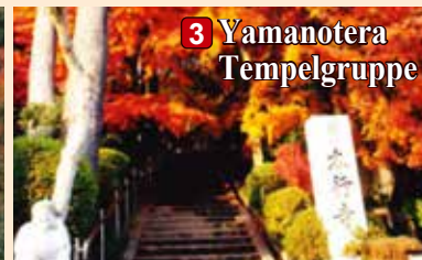
3 Yamanotera Tempelgruppe

■ Auskunft: Natadera Tempel (TEL: 0761-65-2111)