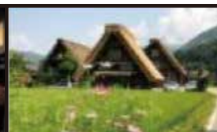
● Tateyama Kurobe Alpenroute (Toyama Bahnhof)