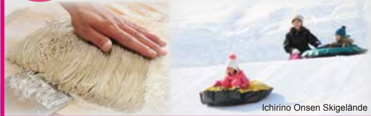
Ichirino Onsen Skigelände

■ Auskunfts: White Ring TEL 076-256-7488