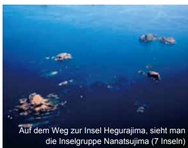
Auf dem Weg zur Insel Hegurajima, sieht man die Inselgruppe Nanatsujima (7 Inseln)

http://www11.ocn.ne.jp/~hegura/index.html (Japanisch)