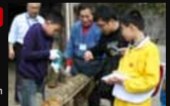
↑ Ein vielfältiges Angebot an Aktivitäten