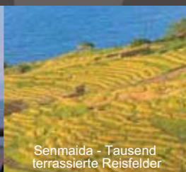
Senmaida - Tausend terrasierte Reisfelder