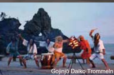
Gojinjō Daiko Trommeln

„Notos Satoyama und Satoumi“ wurden als ein GIAHS ausgezeichnet!