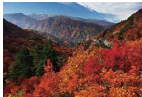
<Hakusan Super Forest Road>