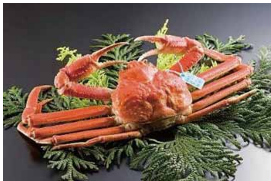
<KANO Krebs aus Ishikawa>

Ishikawa ist vom Meer umgeben und daher reich an Meeresfrüchten. Insbesondere im Herbst und Winter ist die beste Zeit für Krabben, Garnelen, Gelbschwanz. Viele Touristen kommen wegen der saisonalen Meeresfrüchte nach Ishikawa. Genießen Sie im kalten Winter die Wärme der heißen Quelle zur Entspannung und dann die leckeren Meeresfrüchte. Ishikawa bietet Ihnen eine reizvolle Reise voller Hochgenüsse!