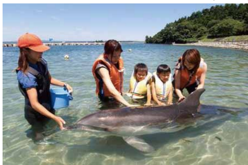
[Bucht für Kontakt mit Delfinen]

http://www.notoaqua.jp/ (Japanisch/Englisch)