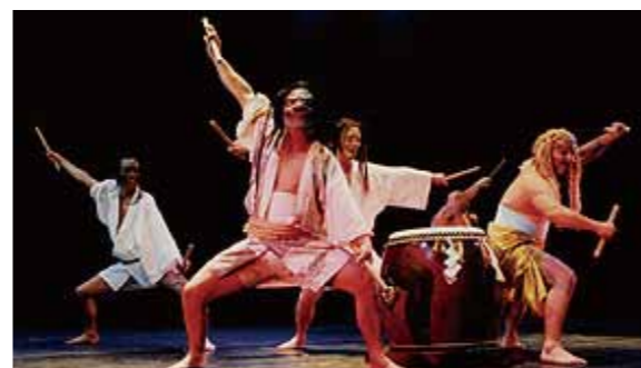
[Gojinjo-daiko Japanische traditionelle Trommeln]