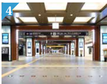
4 Dem Tsuzumi-Tor nachempfundene 24 torförmige Pfeiler!