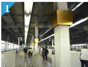
1 Die Pfeiler des Shinkansen-Bahnsteigs sind mit mehr als 20.000 Stück Blattgold dekoriert

Der Hokuriku-Shinkansen-Bahnhof Kanazawa stellt sich in seiner neuen, anziehenden Gestalt traditionellen Handwerks der Präfektur Ishikawa vor! 5