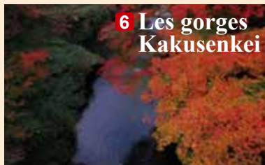
6 Les gorges Kakusenkei

■ Contact : Château de Kanazawa / Bureau d'exploitation du jardin Kenrokuen (TEL 076-234-3800)