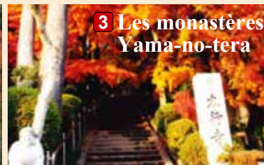
3 Les monastères Yama-no-tera

■ Contact : Monastère Natadera (TEL 0761-65-2111)