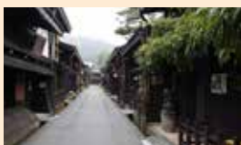
Anciennes rues de Takayama