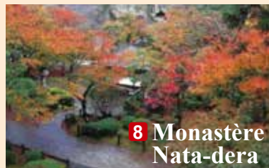
8 Monastère Nata-dera

■ Contact : Association de tourisme de Yamanaka Onsen (TEL 0761-78-0330)