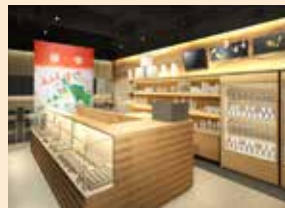
Il s'agit d'images

Contact : Kamazawa Hyakubangai (TEL: 076-260-3700) http://www.100bangai.co.jp/floor/floorinfo.php?floor=omiyage