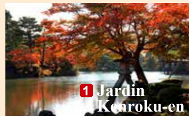
1 Jardin Kenroku-en

↓ D'autres sites recommandés pour apprécier la magnificence des feuillages d'automne à Ishikawa. ↓