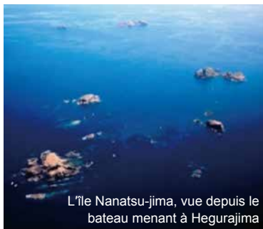
L'île Nanatsu-jima, vue depuis le bateau menant à Hegurajima

■ Renseignement : Hegura Kôro (Tel. 0768-22-4381) (Durée du trajet : 90 min. - Une liaison par jour) http://www11.ocn.ne.jp/~hegura/index.html (En japonais)