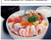
Noto-don : un bol de riz garni de fruits de mer locaux de première fraîcheur