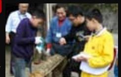
↑ | Ein vielfältiges Angebot an Aktivitäten