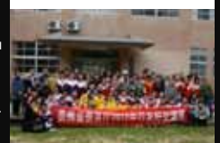
↓ | Gastfamilien