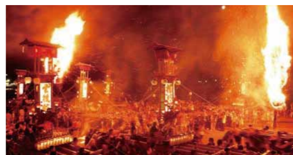
[Festival Abare (Saccage)]