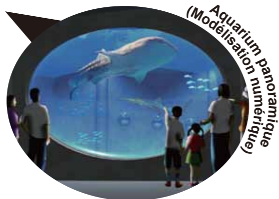
Aquarium panoramique (Modélisation numérique)