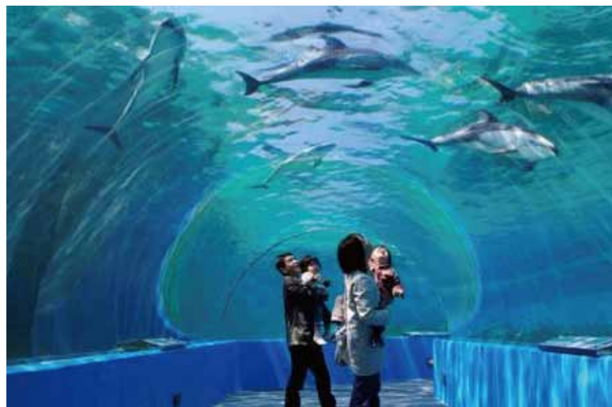
[Paradis des dauphins]