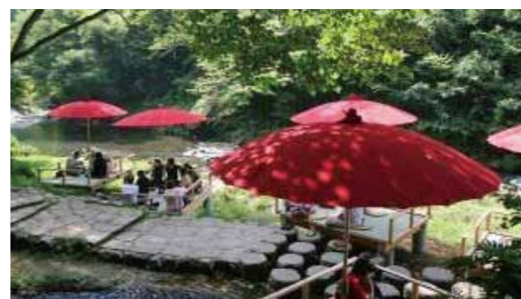
[Cafés Kawadoko Kakusenkei]