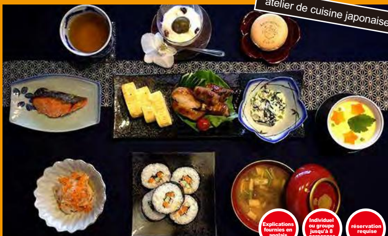
atelier de cuisine japonaise

Explications fournies en anglais. Individuel ou groupe jusqu'à 8 personnes. réservation requise