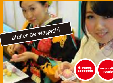
atelier de wagashi