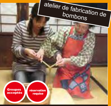
atelier de fabrication de bombons