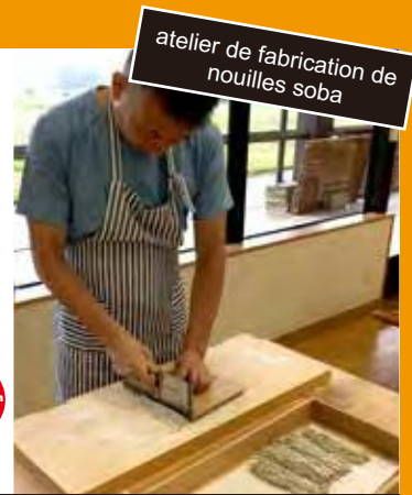
atelier de fabrication de nouilles soba