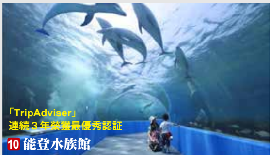
「TripAdvisor」 連續 3 年榮獲最優秀認證

被美國的旅行雜誌「TravelRanger」選為是世界的車站中最為美麗的車站之一。