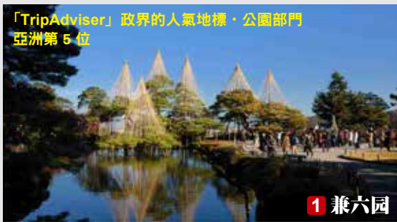
「TripAdvisor」政界的人氣地標・公園部門 亞洲第 5 位