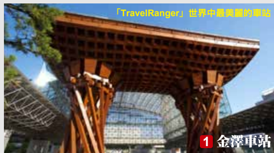
「TravelRanger」世界中最美麗的車站

世界最大的旅行口碑網頁「TripAdvisor」的世界人氣地標・公園部門之亞洲區、被選為第 5 位人氣。