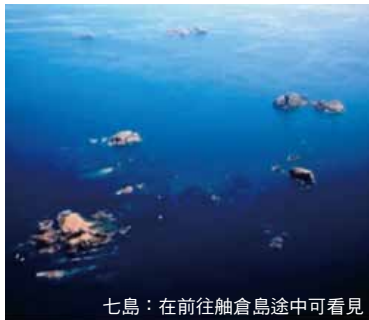
七島：在前往舢倉島途中可看見

海女就是不配帶任何的潛水裝備、單單只穿潛水衣潛至海底捕捉鮑魚或是海螺等貝類或是海藻類的女性。輪島的海女從古早時代開始就有此漁獵活動、據說已有350年以上的歷史了。