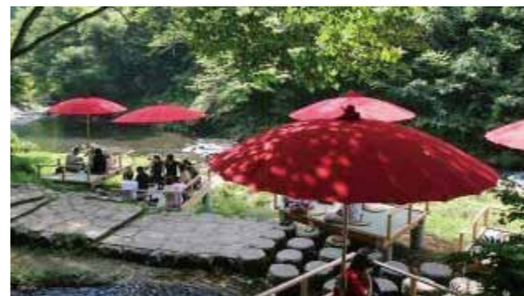
<鶴仙溪 川岸休息處>