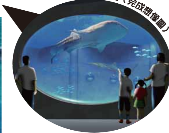
全景大型水槽 (完成想像圖)