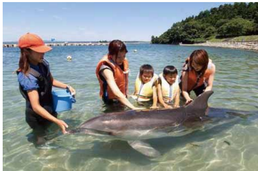
<和海豚交流海灘區>