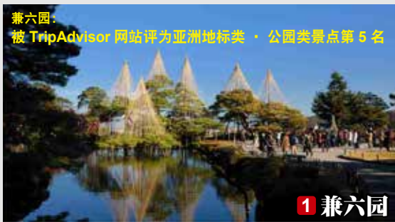
兼六园： 被 TripAdvisor 网站评为亚洲地标类 · 公园类景点第 5 名