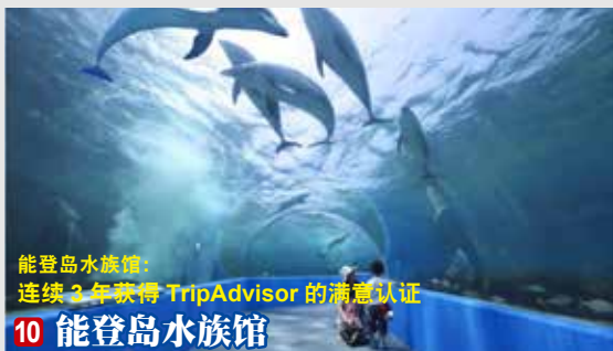
能登岛水族馆： 连续 3 年获得 TripAdvisor 的满意认证

美国旅游杂志《Travel+Leisure》将金泽站评选为世界上最美的车站之一。