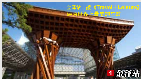
金泽站：被《Travel+Leisure》 评为世界上最美的车站

在世界上最大的旅行点评网站 TripAdvisor 上，兼六园被评为世界人气地标类 · 公园类景点亚洲第五名。