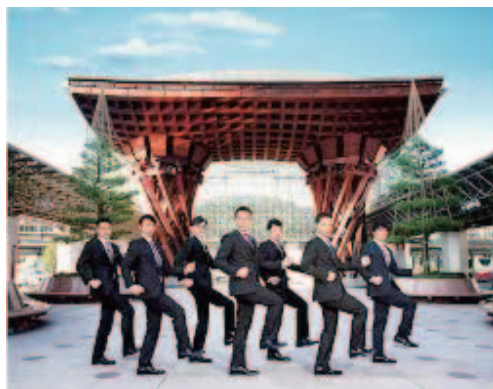
© Japan Association of Travel Agents (JATA)

http://www.youtube.com/watch?v=vQosBq6B9hU