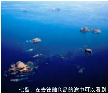
七岛：在去往舢仓岛的途中可以看到

■ 联系方式 舢仓航路株式会社 (Tel: 0768-22-4381) (90分钟·每天1班往返) http://www11.ocn.ne.jp/~hegura/index.html (日语)