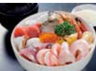
午餐享用新鲜美味的能登海鲜盖饭