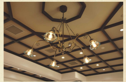
2階多目的室の天井

隣接する旧陸軍第九師団司令部庁舎とは対照的に、バロック風の技巧的な装飾を用いた華やかな外観が特徴です。内部の見どころは、2階多目的室の格子状の天井とシャンデリアで、明治期の雰囲気再現されています。