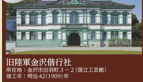
旧陸軍金沢偕行社 所在地：金沢市出羽町3-2(国立工芸館) 竣工年：明治42(1909)年

陸軍将校の集会所として、現在の県立能楽堂横に建築された建物です。戦後は県の庁舎などに使用されてきましたが、旧陸軍第九師団司令部庁舎とともに現在地に移築され、「国立工芸館」として活用されています。