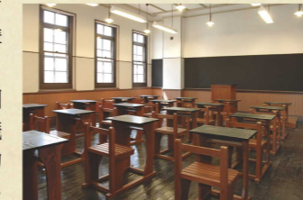
復元教室(2階多目的利用室)

建築当初の外観や間取り、構造が今もなお残されている貴重な建物で、当時の雰囲気を感じることができます。