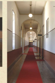
明治期の雰囲気を残す廊下

〈石川四高記念文化交流館〉 ●開館時間：9:00～21:00(展示室・近代文学館は17:00まで) ●休館日：年末年始 ●料 金：四高記念館：無料/近代文学館：一般370円、大学生290円、高校生以下無料