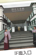
正面入口 借行社前