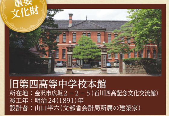
旧第四高等学校本館 所在地：金沢市広坂2-2-5(石川四高記念文化交流館) 竣工年：明治24(1891)年 設計者：山口半六(文部省会計局所属の建築家)

旧第四高等学校本館として建てられたこの建物は、閉校後、金沢大学や石川県立郷土資料館(現：石川県立歴史博物館)などとして使用されてきましたが、現在は、四高の歴史と伝統を紹介する石川四高記念館と、石川県ゆかりの文学者を紹介する石川近代文学館で構成されています。