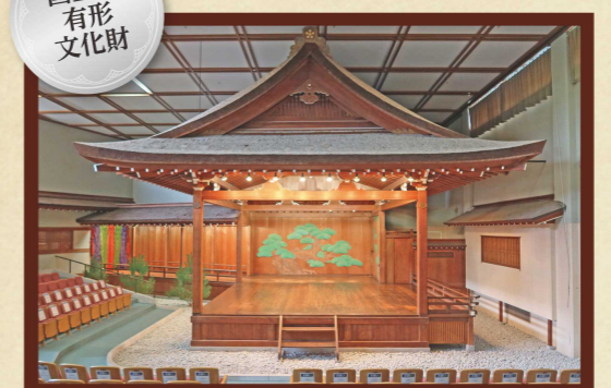
石川県立能楽堂能舞台 所在地：金沢市石引14-18-3 竣工年：昭和6(1931)年 設計者：辰巳才一郎

戦後、全国初の独立した公立能楽堂として開館した県立能楽堂の能舞台は、かつて、金沢市の中心部である広坂に建てていた金沢能楽堂の能舞台を橋掛りとともに移築したものです。