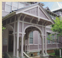
玄関の車寄せ 当時の中学校校舎の設計指針を踏まえつつも、屋根の小窓や車寄せに施された透彫等に獨創性がみられます。

全体的に洋風の意匠が施された外観で、両翼部の内側には尖塔が設けられ、三角形を強調した中央の屋根と合わせ、校舎の愛称であった「三尖塔校舎」の由来とされています。建物内部も竣工当初の形式を良く残しており、当時の学校建築の様子を知ることができる貴重な建物です。