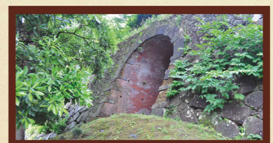
旧陸軍弾薬庫隧道 所在地：金沢市丸の内1-1(金沢城公園内) 竣工年：不明