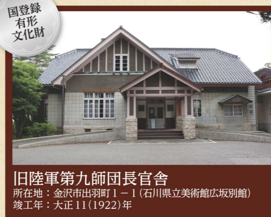
旧陸軍第九師団長官舎 所在地：金沢市出羽町1-1(石川県立美術館広坂別館) 竣工年：大正11(1922)年

師団長の官舎として建築された建物です。戦後は、米軍将校の官舎、金沢家庭裁判所、石川県児童館等、様々な施設として使われてきましたが、平成20年以降は「石川県立美術館広坂別館」としてギャラリーや茶会等、県民の文化活動の場として使用されており、自由に見学することができます。また、隣接している石川県文化財保存修復工房のガイダンス施設としても活用されています。