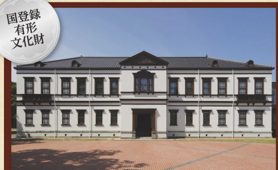
旧陸軍第九師団司令部庁舎 所在地：金沢市出羽町3-2(国立工芸館) 竣工年：明治31(1898)年

旧陸軍第九師団の司令部庁舎として、金沢城二ノ丸跡に建築された建物です。戦後は移築され、県の庁舎などに使用されてきましたが、旧陸軍金沢偕行社と合わせて現在地に移築され、日本で唯一の国立で工芸を専門とする美術館である「国立工芸館」として活用されています。