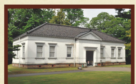
旧陸軍歩兵第六旅団司令部庁舎 所在地：金沢市丸の内1-1(金沢城公園内) 竣工年：明治31(1898)年

※旅団：日本陸軍の戦略単位で、師団の下位、連隊の上位の組織。金沢には、歩兵第七・第三十五連隊を統括する第六旅団が置かれた。