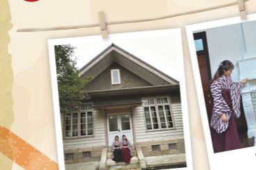
建物背面 旧応接室