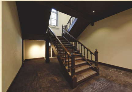
ケヤキ造りの階段

左右対称の木造2階建てで簡素な庁舎らしい外観が特徴です。内部は、重厚なケヤキ造りの階段や天井の漆喰レリーフなど明治期の洋風建築の意匠が復元・保存され、当時の雰囲気を感じられます。