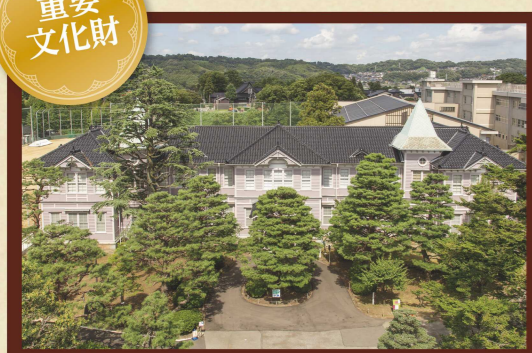
旧石川県第二中学校本館 所在地：金沢市飛梅町3-31 (金沢くらしの博物館) 竣工年：明治32(1899)年 設計者：山口孝吉(石川県技師)

旧石川県第二中学校の校舎として建てられた洋風木造建築で、現在は、金沢の風物詩や昔ながらの生活用品、伝統産業の製作用具などを紹介する「金沢くらしの博物館」として活用されています。