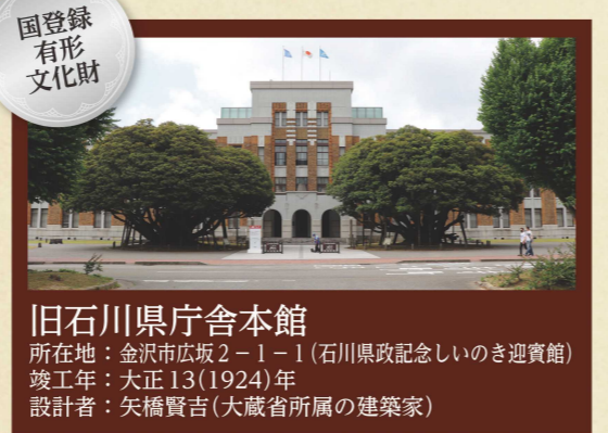
旧石川県庁舎本館 所在地：金沢市広坂2-1-1(石川県政記念しいのき迎賓館) 竣工年：大正13(1924)年 設計者：矢橋賢吉(大蔵省所属の建築家)

周辺の総合案内やレストラン、会議室などを備えた「しいのき迎賓館」として活用されている旧石川県庁舎は、本県初の本格的な鉄筋コンクリート造の建物です。当時最先端だったスクラッチタイルが使用された外壁と、幾何学的装飾を要所に配した端正で落ち着いた意匠が魅力です。