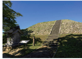
能登9 雨の宮古墳群