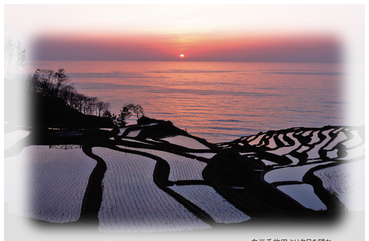
白米千枚田より夕日を望む